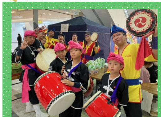
ボランティア活動の様子

三重県内のお祭り(四日市祭り、鈴フェス、津祭りなど)へ出演していますので、イベントの告知を見かけたら、会場へ足を運んでステージを観覧してもらえるとありがたいです。