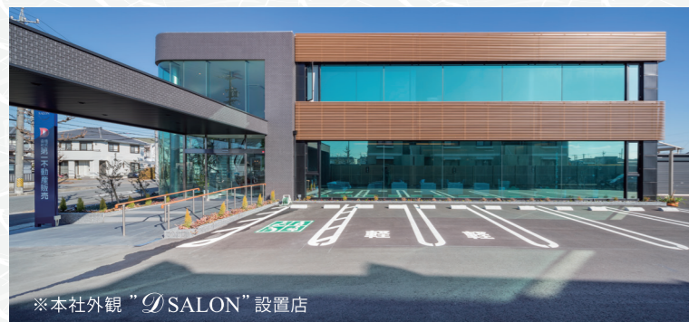
※本社外観 "Dsalon" 設置店