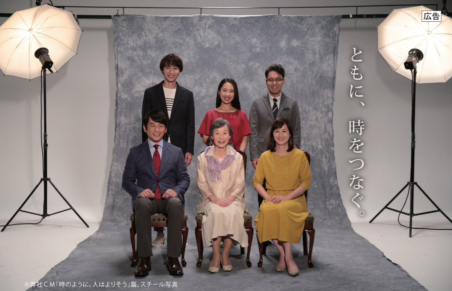
※弊社CM「時のように、人はよりそう」篇、スチール写真